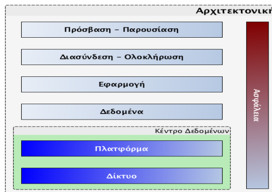
Εικόνα 1: Πληροφοριακή αρχιτεκτονική

Η Πληροφοριακή Αρχιτεκτονική της Ελληνικής Αστυνομίας τελεί υπό την αποκλειστική αρμοδιότητα της Διεύθυνσης Πληροφορικής της Ελληνικής Αστυνομίας και αποτελεί εξειδίκευση των επιπέδων α) Δεδομένων, β) Εφαρμογής και γ) Τεχνολογίας, της Επιχειρησιακής Αρχιτεκτονικής της Ελληνικής Αστυνομίας. Η Πληροφοριακή Αρχιτεκτονική διαρθρώνεται στα ακόλουθα επίπεδα ως εξής: