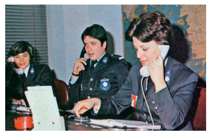
Το τηλεφωνικό κέντρο (171) παροχής τουριστικών πληροφοριών της Διεύθυνσης Τουριστικής Αστυνομίας

Σταθμός στην ιστορία της Τουριστικής Αστυνομίας ήταν η ίδρυση και λειτουργία του Τηλεφωνικού Κέντρου παροχής πληροφοριών τουριστικού ενδιαφέροντος ( με αριθμό κλήσης 171 ) στα τέλη της δεκαετίας του '70, με αξιόλογη καθημερινή δραστηριότητα για την εξυπηρέτηση ημεδαπών και αλλοδαπών τουριστών και ταυτόχρονη υποβοήθηση της κυβερνητικής πολιτικής για τον τουρισμό με πολλαπλά μάλιστα οφέλη. Το τηλεφωνικό Κέντρο που λειτουργούσε καθημερινά σε 24ωρη βάση, στελεχώθηκε με γλωσσομαθείς αστυνομικούς, που παράλληλα διέθεταν και ειδικές γνώσεις, προσφέροντας με ταχύτητα και ακρίβεια πολύτιμες πληροφορίες προς διευκόλυνση των ενδιαφερομένων.