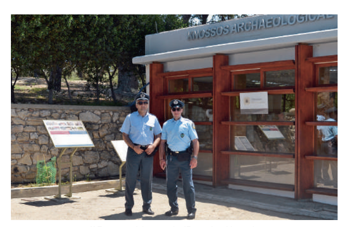
Η Τουριστική Αστυνομία έξω από το Μουσείο στον αρχαιολογικό χώρο της Κνωσού

Στις μέρες μας με την επικείμενη αναδιάρθρωση των Υπηρεσιών της Ελληνικής Αστυνομίας (Π.Δ. 7/2017 – Φ.Ε.Κ. 14/A/09.02.2017) και όπως ορίζουν το άρθρα 101 και 105, δημιουργούνται Τμήματα και Σταθμοί Τουριστικής Αστυνομίας στις Διευθύνσεις Αστυνομίας Νομών. Στην εσωτερική διάρθρωση των Τμημάτων Τουριστικής Αστυνομίας προβλέπεται n λειτουργία Γραφείου Τουρισμού , το οποίο είναι αρμόδιο για την εφαρμογή των διατάξεων της τουριστικής νομοθεσίας και την εξυπηρέτηση των τουριστών, την εκτέλεση προγραμμάτων τουριστικής αστυνόμευσης και τη συγκέντρωση απαραίτητων στοιχείων τουριστικού ενδιαφέροντος. Οι Σταθμοί Τουριστι κής Αστυνομίας θα ασκούν επίσης στην περιοχή δικαιοδοσίας τους το σύνολο των αρμοδιοτήτων των ανωτέρω Τμημάτων. Τέλος, αξίζει να σημειωθεί η σύσταση Γραφείων Τουρισμού σε Αστυνομικά Τμήματα περιοχών υψηλού τουριστικού ενδιαφέροντος, όπως της Αρχαίας Ολυμπίας, της Μυκόνου, της