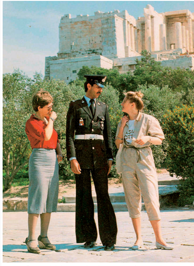
Γλωσσομαθείς Αστυνομικοί παρέχουν πληροφορίες σε τουρίστες